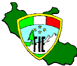
Federazione Italiana Escursionismo