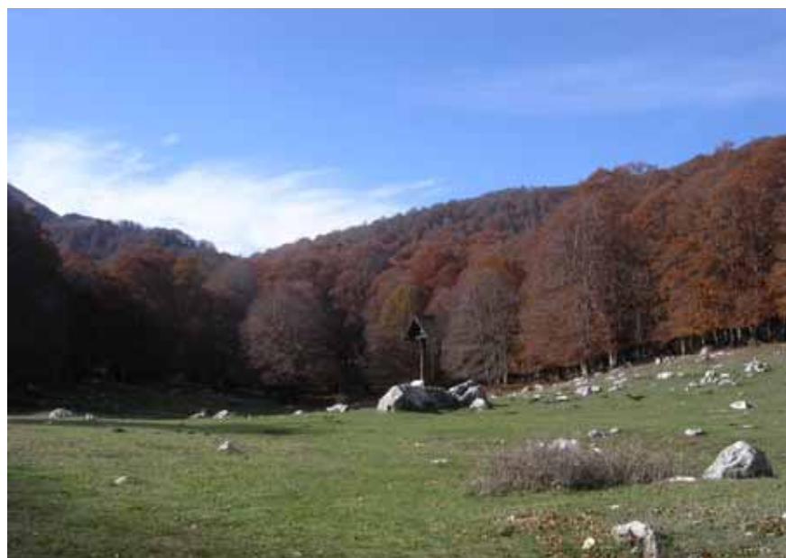
Foto: paesaggi d'autunno nella Valle del Giovenco

UNO SPECIALE APPUNTAMENTO MIRATO ALLA PROMOZIONE DEL TURISMO SOSTENIBILE NELLE TERRE DELL'ABRUZZO MARSICANO, CON LE ASSOCIAZIONI LOCALI CHIAMATE NELLA CIRCOSTANZA A FAR RIVIVERE FRAMMENTI DI VITA RURALE E PASTORALE VISSUTA NELLA STRAORDINARIA VALLE DEL GIOVENCO, RICCA DI RISORSE AMBIENTALI, PAESAGGISTICHE E CULTURALI, TUTTE DA SCOPRIRE.